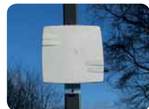
Als Außenzentrale im IP67 Wetterschutzgehäuse erhältlich.

In Zeiten steigender Popularität von PV-Anlagen werden Solarmodule immer öfter zum Ziel von Vandalismus und organisiertem Diebstahl. Neben dem Verlust der wertvollen Module, vernichten auch der Ausfall der Anlage kalkulierte Erträge.